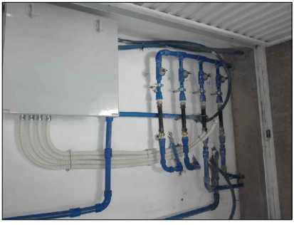
Ejemplo: sala de medición con gabinete eléctrico.