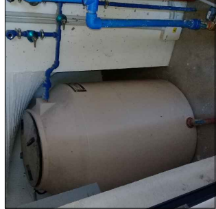
Ejemplo: tanque de bombeo.

Ejemplo: 2 caudalímetros Ø13mm 2 caudalímetros Ø19mm 2 locales 2 viviendas